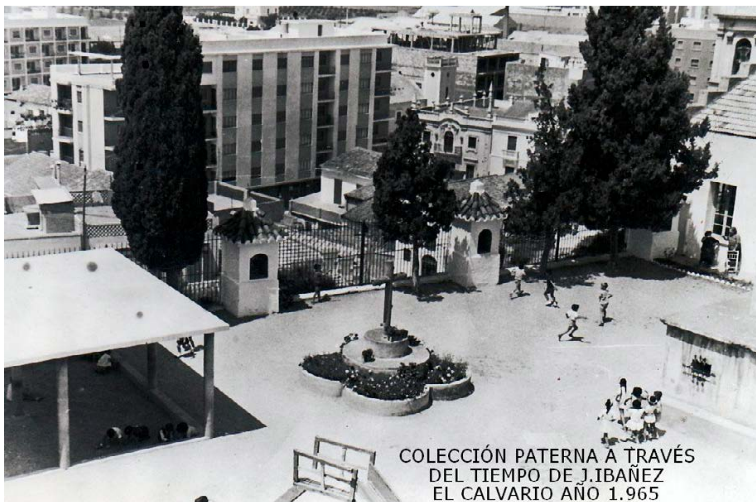
Vista área de las instalaciones del Colegio El Calvario (1965)