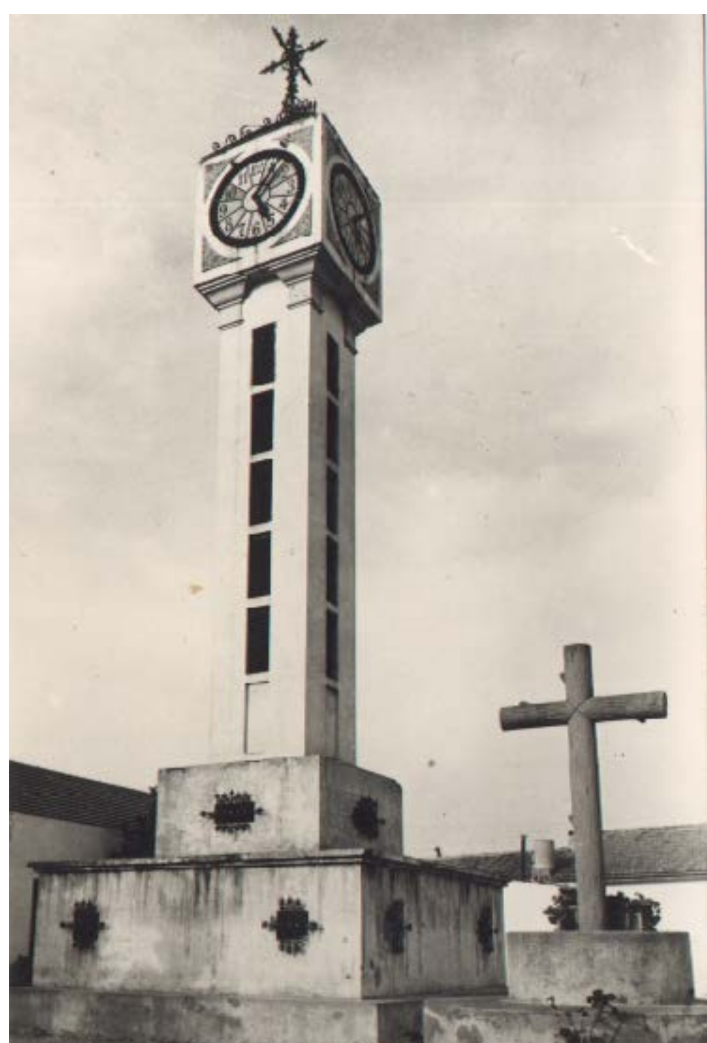
Calvario antiguo con la cruz a su lado

Algunos episodios bélicos, como la Guerra de la Unión en el siglo XIV o las Germanías en el siguiente, y el abandono y uso de materiales en los siglos posteriores para construcción, provocaron su práctica desaparición. Hoy solo se aprecia desde el exterior el muro de contención, que se encuentra unido a la base de las murallas.