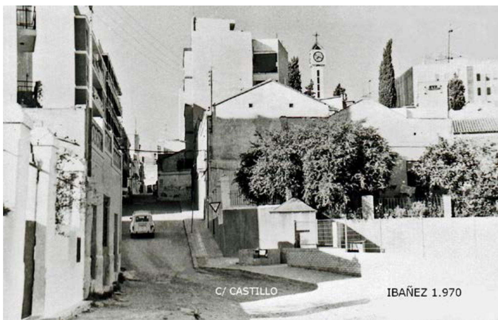
Calle Castillo y vista del Calvario, año 1970

Recibe su nombre del alcázar árabe o castillo cristiano que antiguamente se asentaba donde ahora se sitúa el Calvario. Está enclavado en un lugar estratégico,