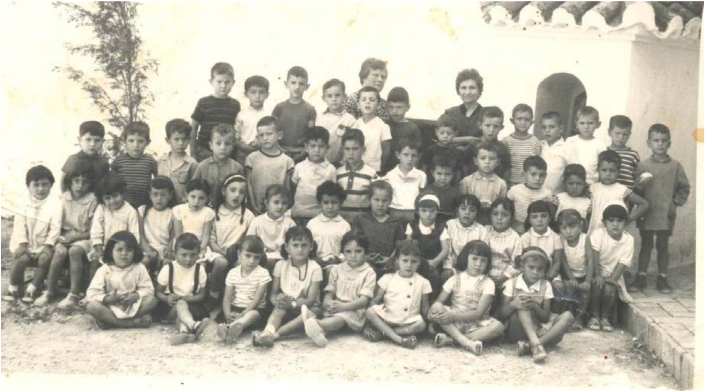
Promoció d'alumnes del Col·legi El Calvari

En 1911, una expedició de Lo Rat Penat de València accedeix a través d'unes galeries contigües a les cases del carrer del Castell, i descobreix una gran estada, que se suposa part de l'antic alcàsser i que s'habilitaria en 1967.