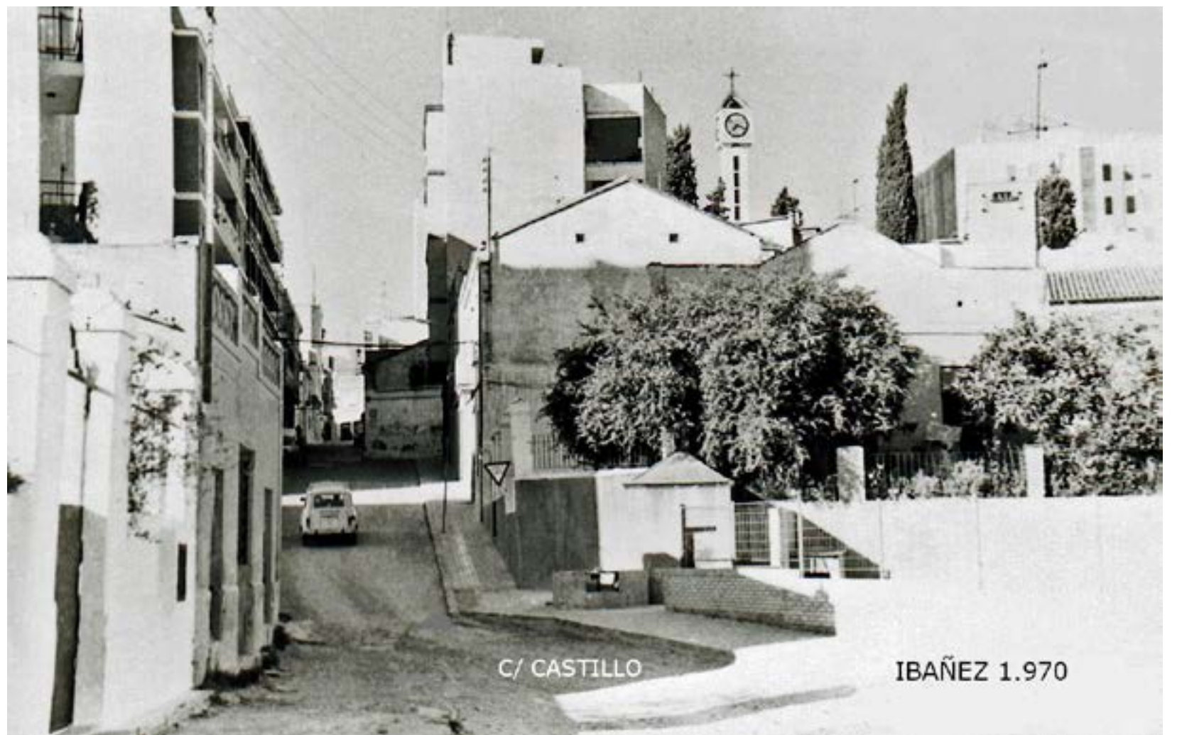
Carrer Castell i vista del Calvari, any 1970

Rep el seu nom de l'alcàsser àrab o castell cristià que antigament s'assentava on ara se situa el Calvari. Està enclavat en un lloc estratègic, ja que des de la