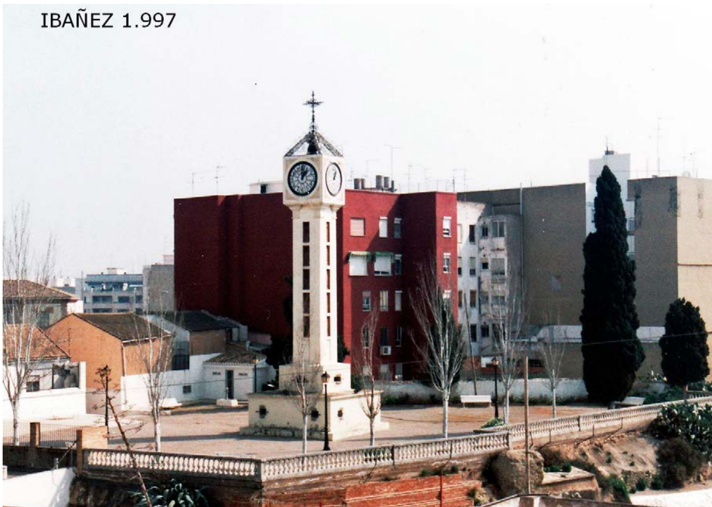
Fotografía de El Calvario (1997)