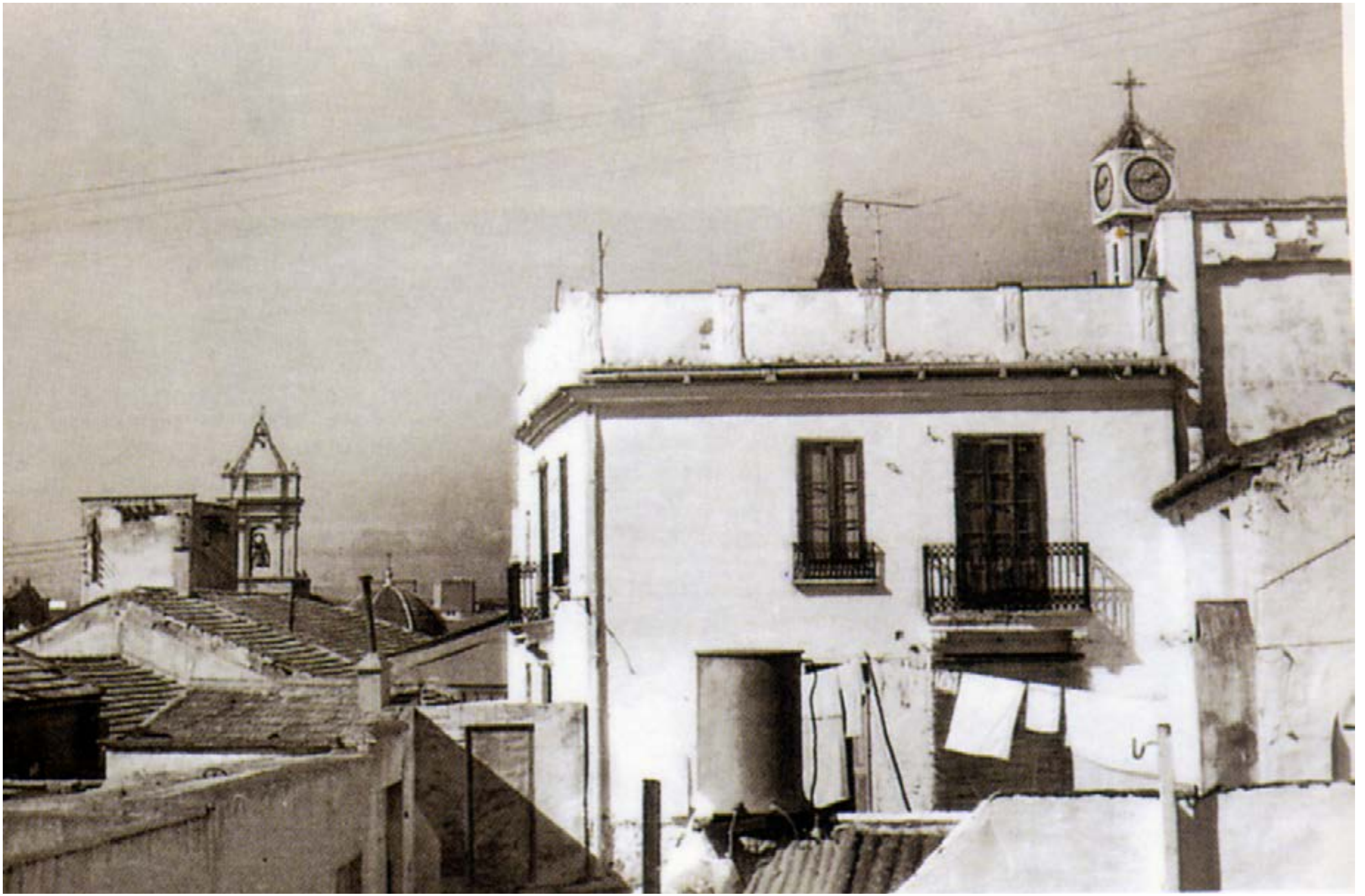
Foto panoràmica de Paterna amb el Calvari de fons