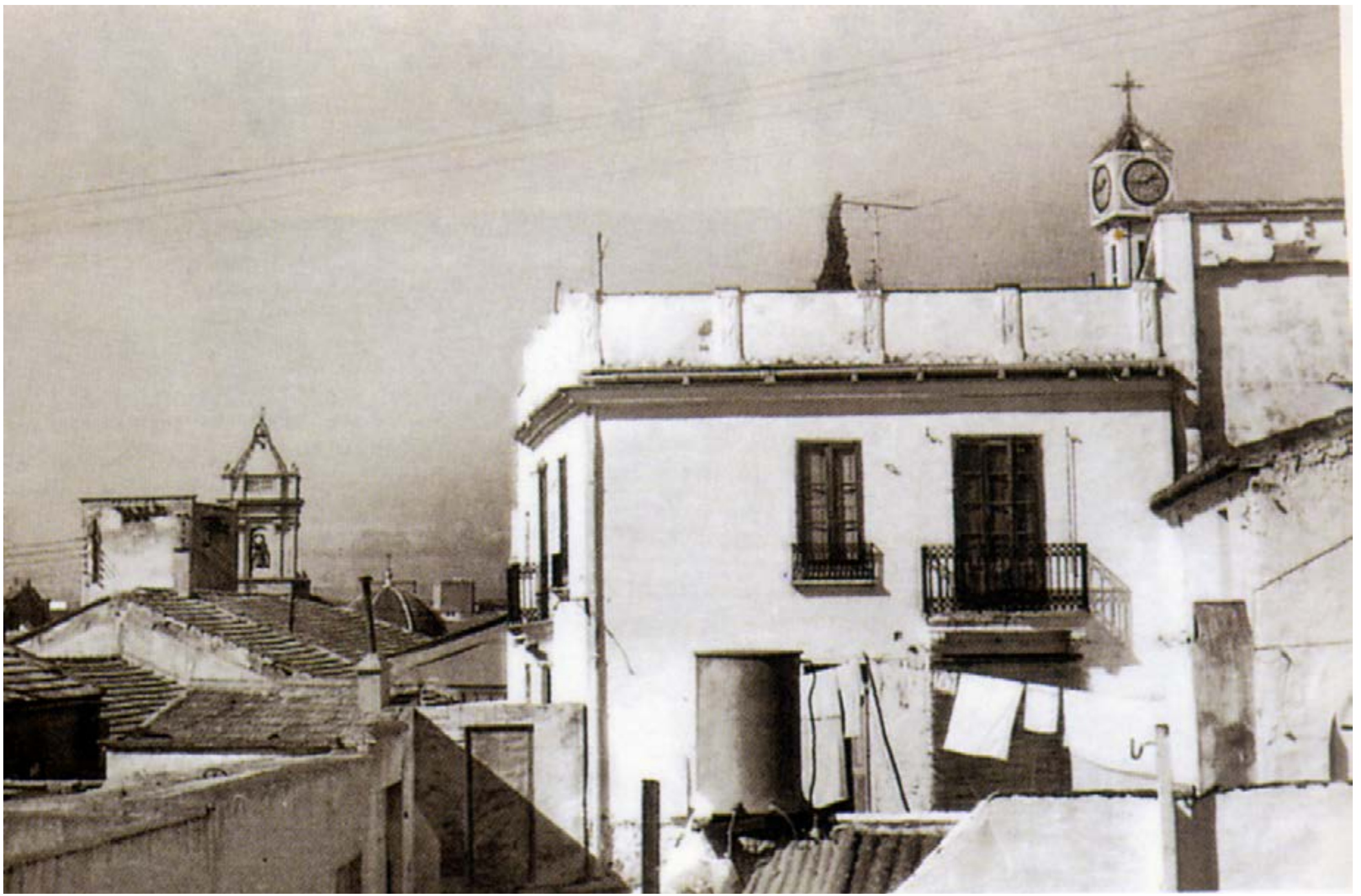
Foto panorámica de Paterna con El Calvario de fondo