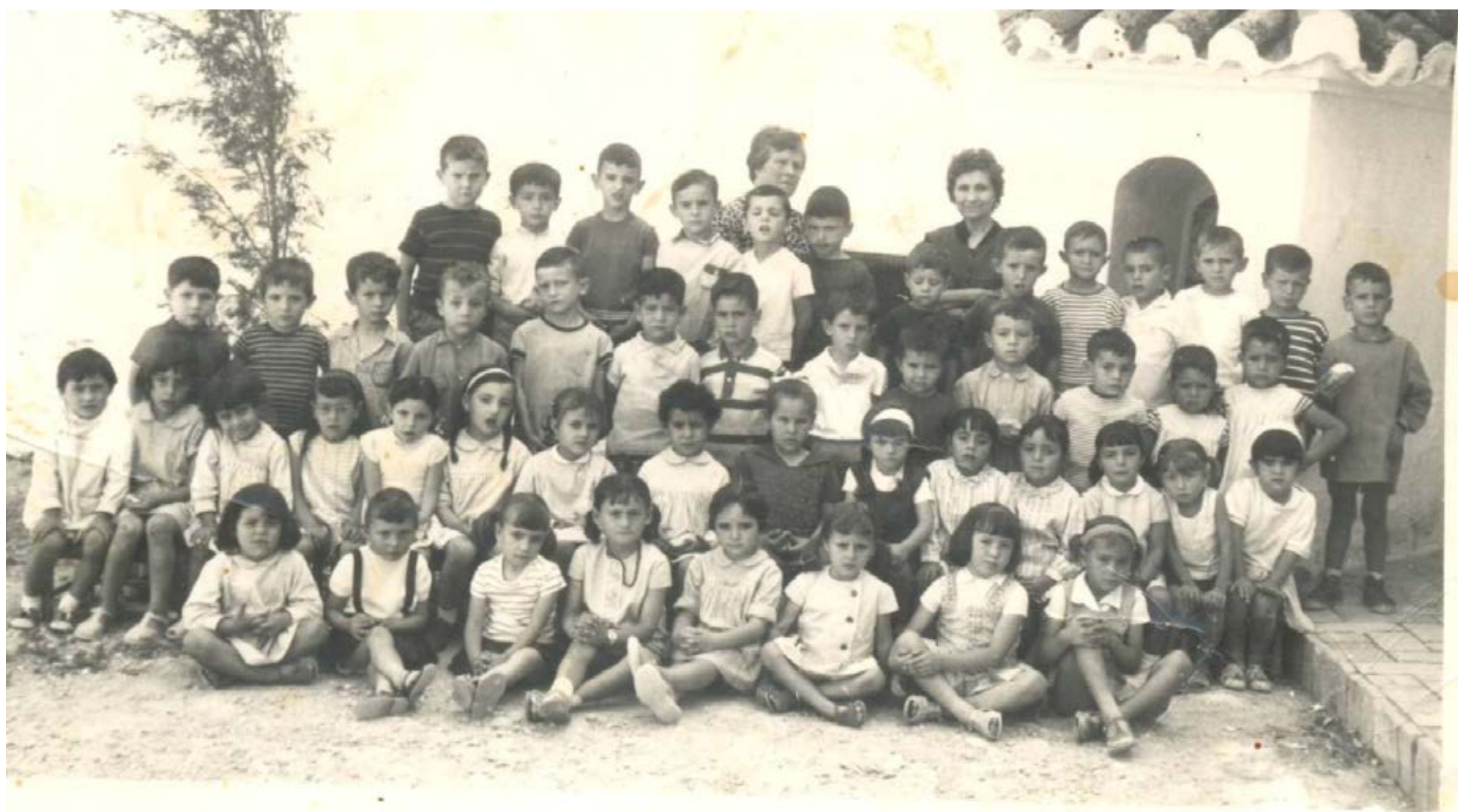
Promoción de alumnos del Colegio El Calvario

En 1911, una expedición de Lo Rat Penat de València accede a través de unas galerías contiguas a las casas de la calle del Castillo, y descubre una gran estancia, que se supone parte del antiguo alcázar y que se habilitaría en 1967.