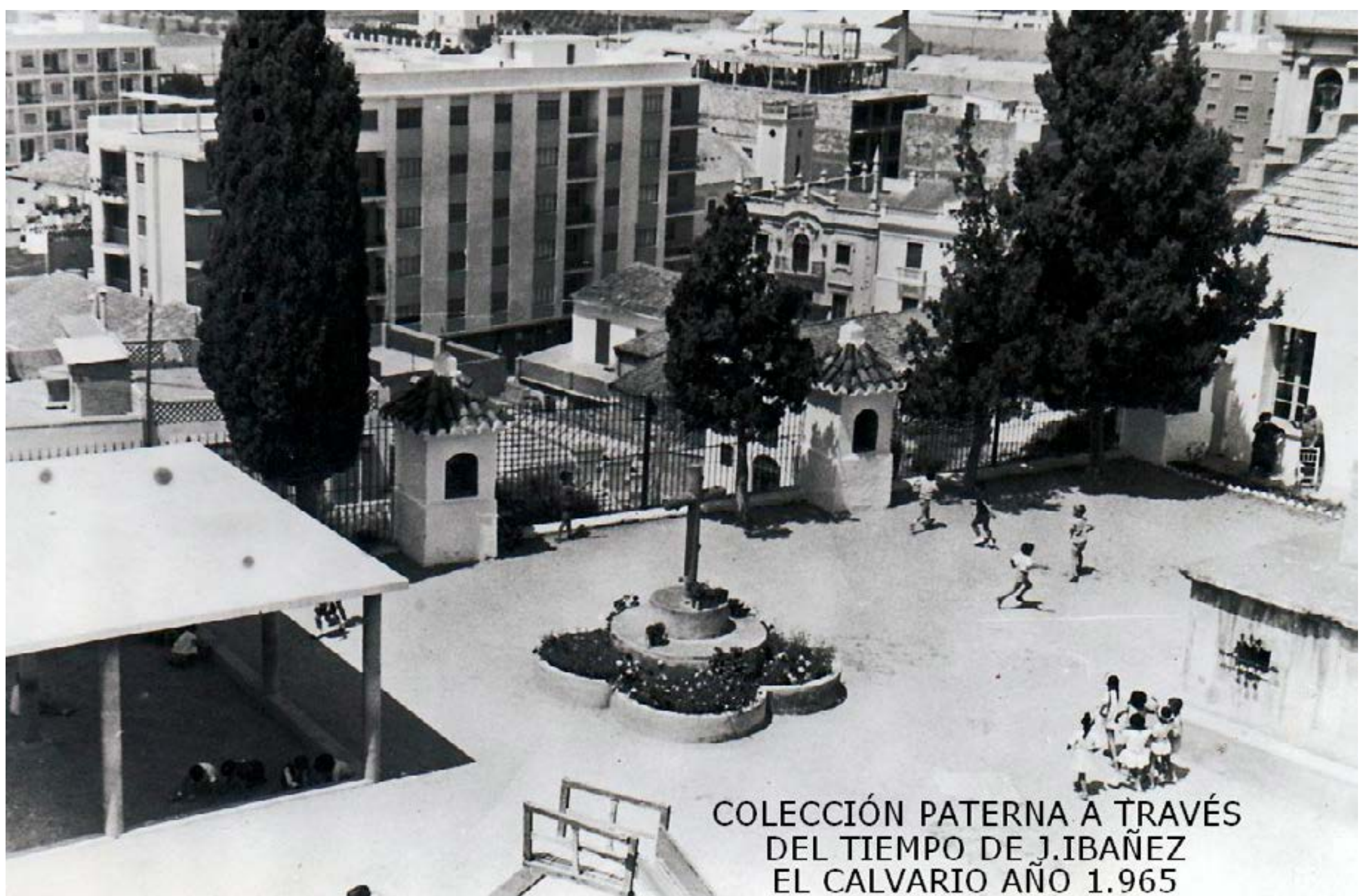
Vista àrea de les instal·lacions del Col·legi El Calvari (1965)