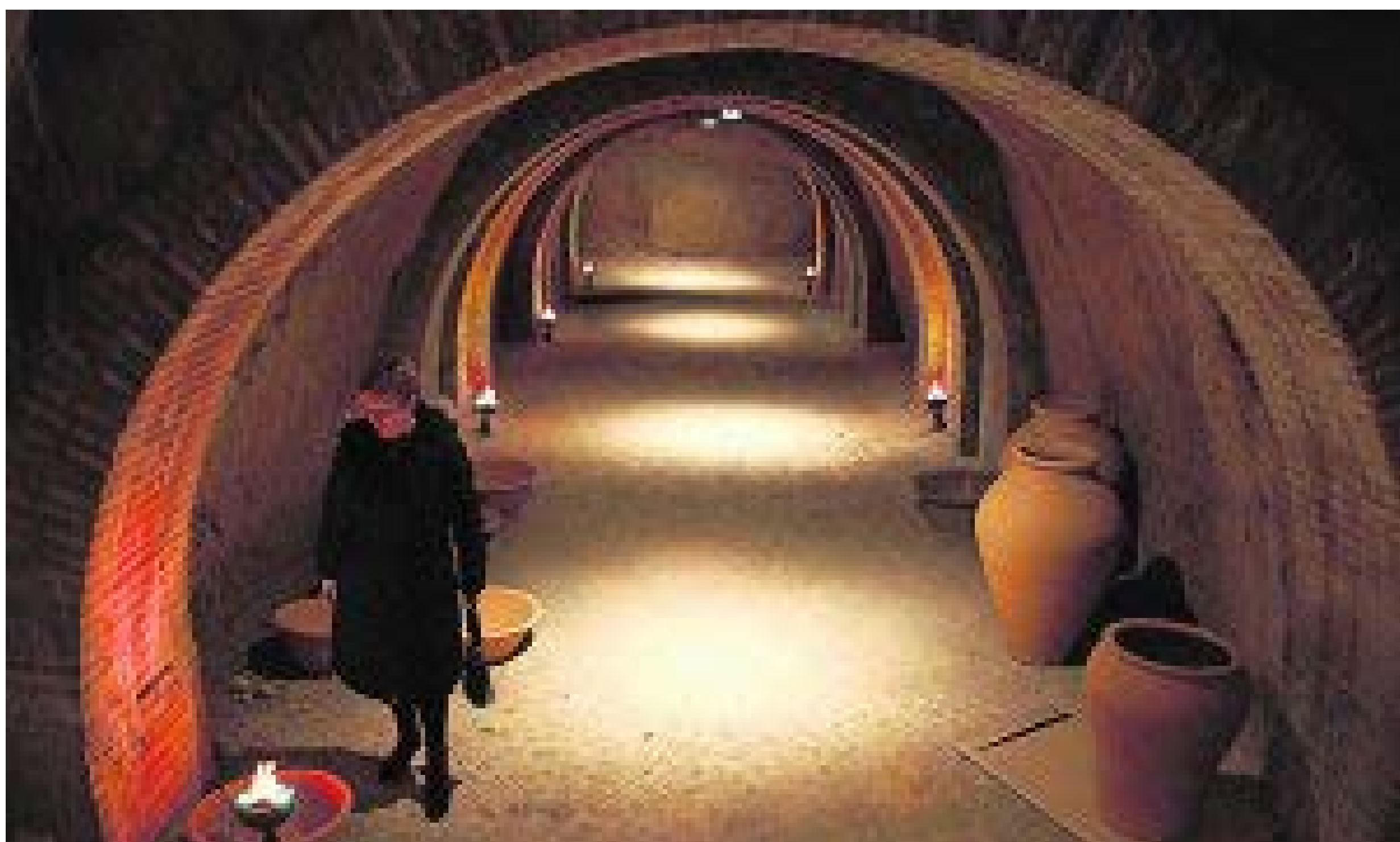
Galería de El Calvario

En 1911, una expedición de Lo Rat Penat de València accede a través de unas galerías contiguas a las casas de la calle del Castillo, y descubre una gran estancia, que se supone parte del antiguo alcázar y que se habilitaría en 1967.