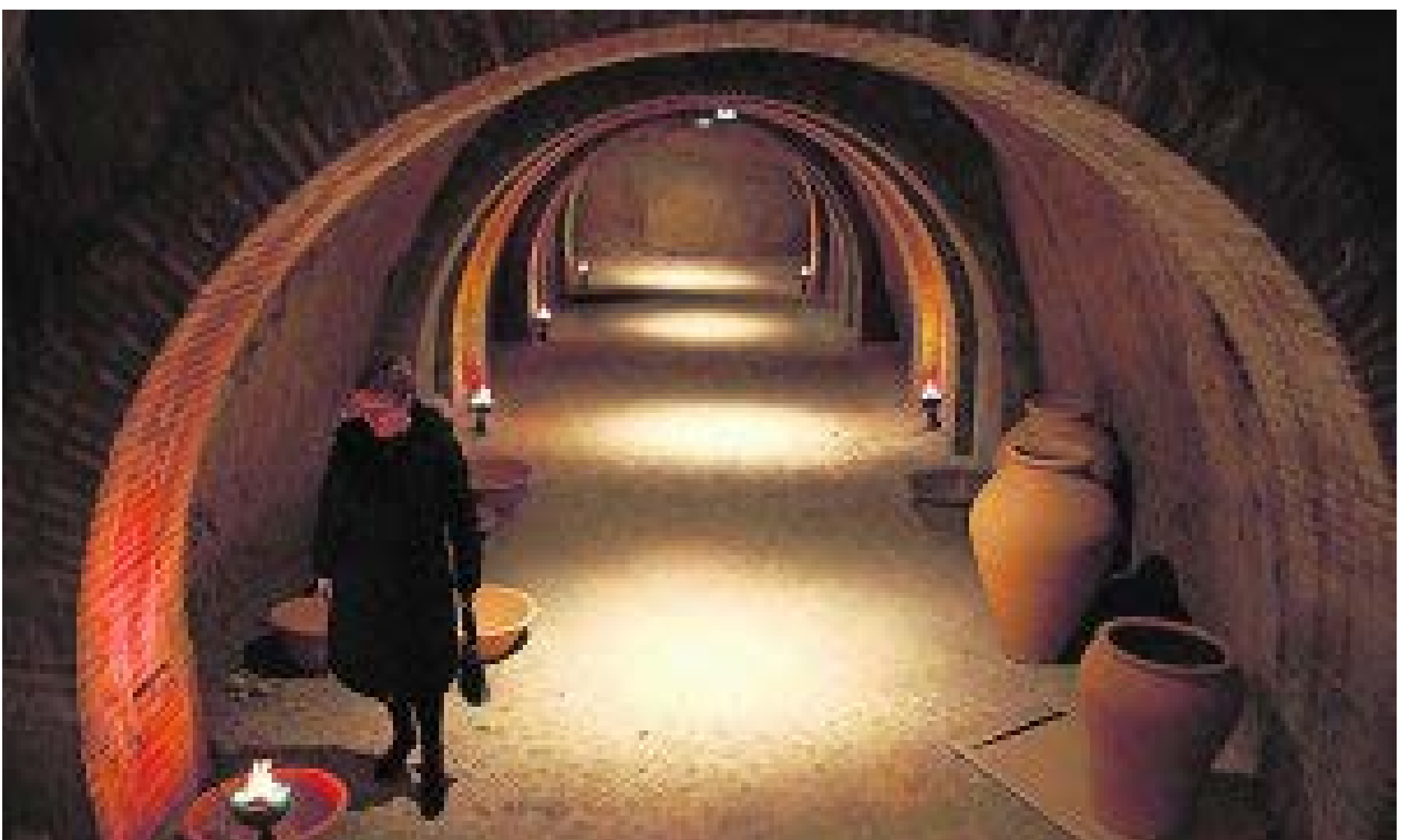
Galeria del Calvari

En 1911, una expedició de Lo Rat Penat de València accedeix a través d'unes galeries contigües a les cases del carrer del Castell, i descobreix una gran estada, que se suposa part de l'antic alcàsser i que s'habilitaria en 1967.