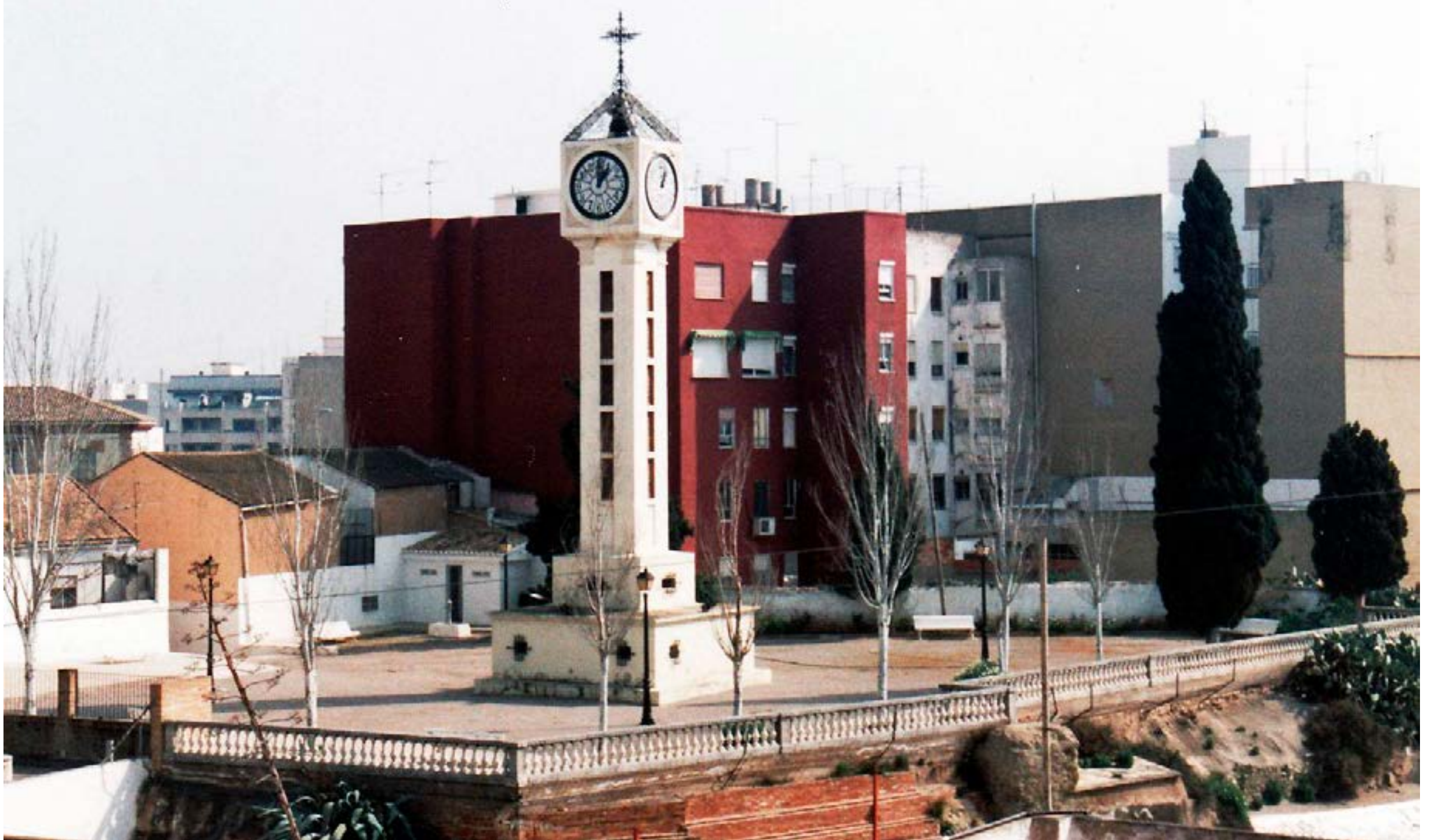
Fotografia del Calvari (1997)