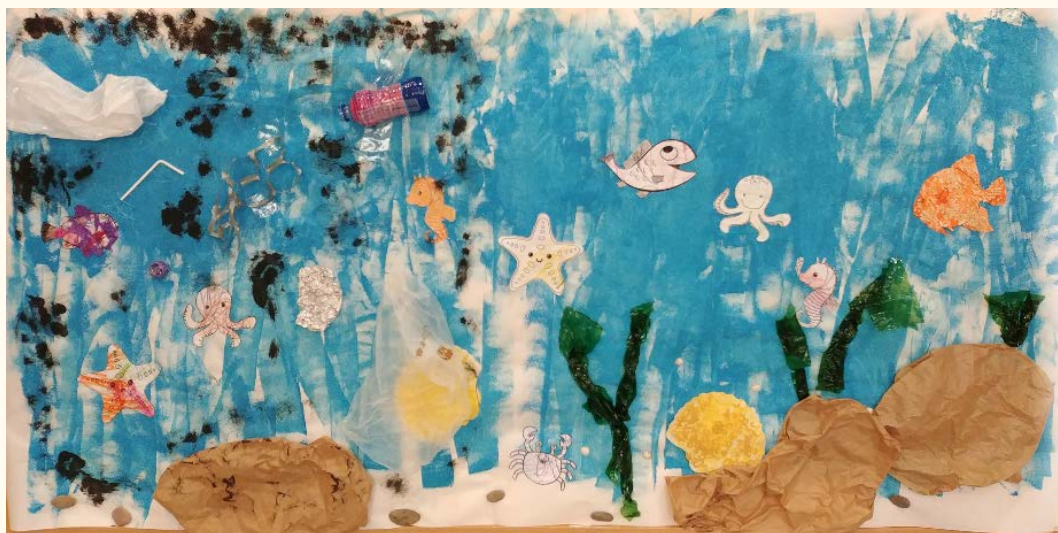
mar contaminado vs mar vivo